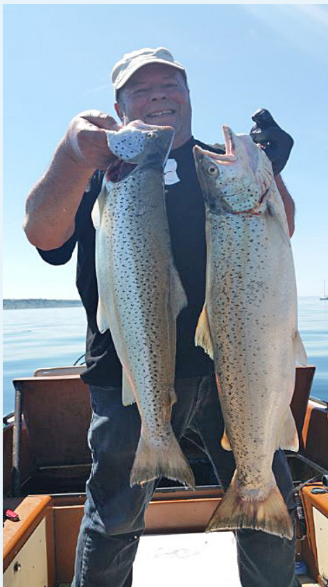
Brustflosse einer Seeforelle

Selten, aber manchmal gibt es Tage da stimmt einfach alles. So wie bei mir am Freitag nach Auffahrt. Ich hatte gleich 2 Bisse von Seeforellen und konnte bei beiden Fischen den Drill erfolgreich beenden und beide ins Boot bringen.