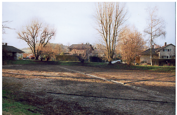
Der für die Aufzucht wieder einwandfrei hergestellte Weiher