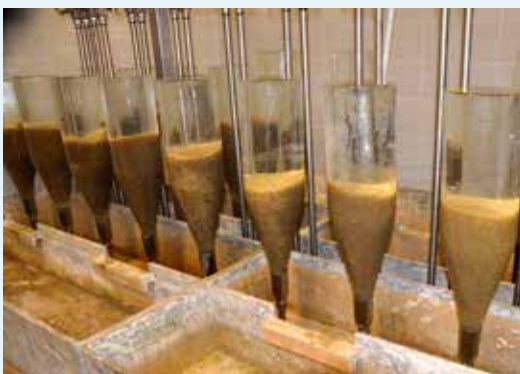
Oben Zur Sicherheit und zum Vergleich werden im ersten Betriebsjahr auch bisherige Zuger Gläser eingesetzt. Die Brütlinge sind bereits erkennbar am dunkeln Punkt (Augen) Die hellen Eier sind nicht befruchtete.