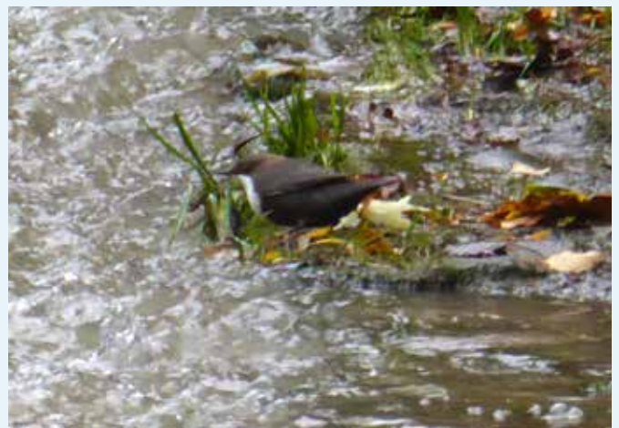
Eine Wasseramsel - der einzige tauchende Singvogel (bis 15 Sek). Vogel des Jahres 2017. In gab es auch Eierschwammerl satt