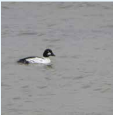
Eine seltene Schellente aus dem Norden

Der Eisvogel fliegt regelmässig aus der Umgebung Badeplatz auf seinen Strauch nahe alter Sportplatz - so lange es dort kleine Fische hat,