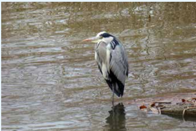
Graureiher mit eingezogenem Kopf