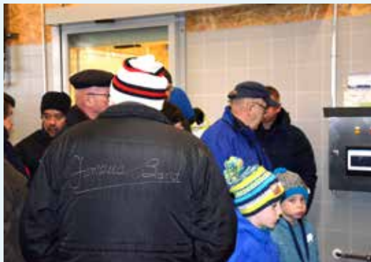
Eine der wichtigsten Aufgaben: Mischen von Seewasser mit Trinkwasser in der für jede Fischart richtigen Temperatur.