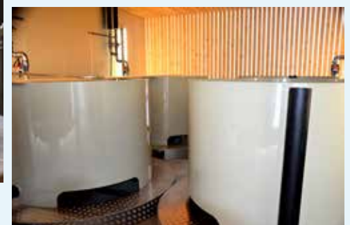
Rundtröge zum Haltern der Muttertiere und zum Aufziehen von Brütlingen