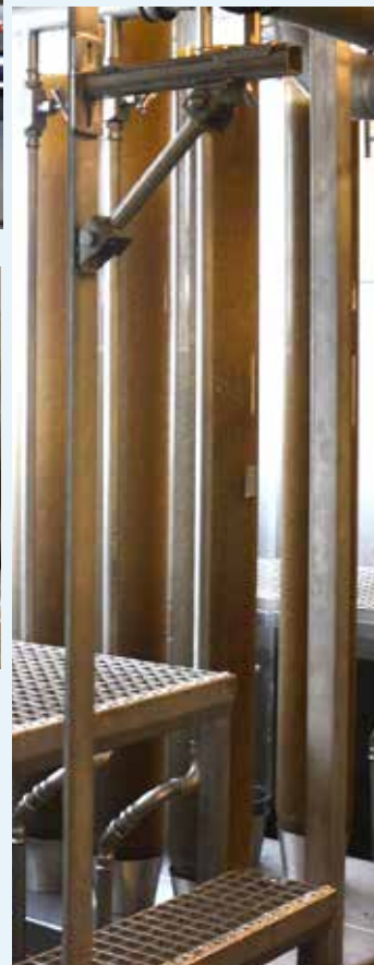
Die neuen über 2 m hohen Brutgläser. Die geschlüpften Brütlinge werden oben automatisch von einem Rohrsystem abgesaugt und landen in den Auffangbecken. Und von hier holt sie der Fischaufseher und setzt sie in den See ein - willkommen!