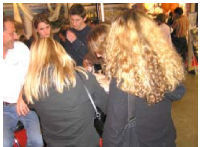
Der Tisch mit dem Wettbewerb wurde oft richtiggehend belagert