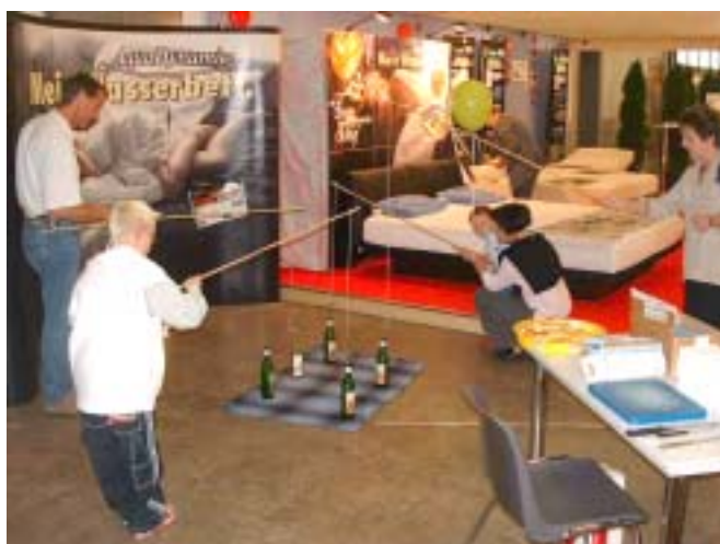
Das Flaschenfischen war so gefragt, dass die Fischweggli als Preise schon am Nachmittag ausgingen