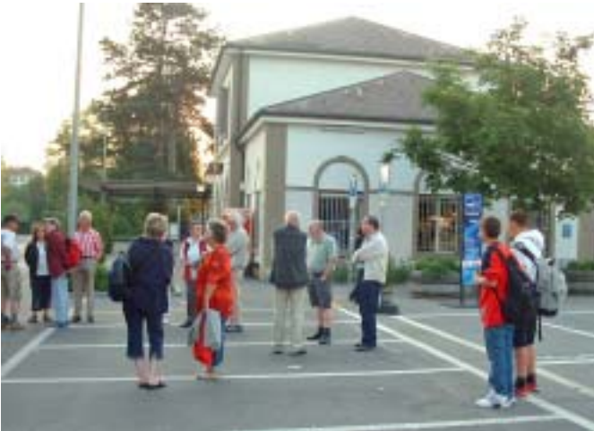
Morgen früh um Sechs .... am Bahnhof Murten