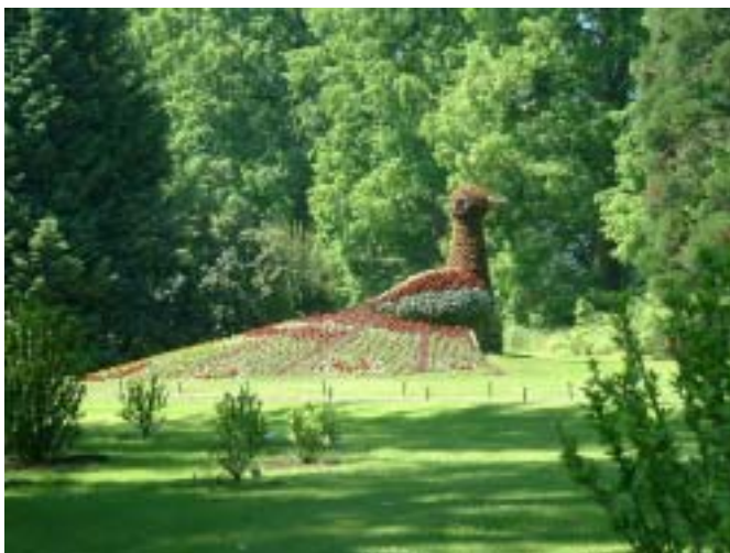
Als Naturliebhaber haben wir die Pflanzenwelt der Insel Mainau bestaunt.