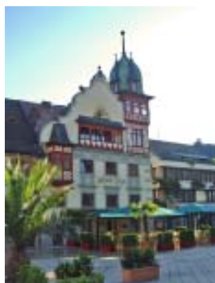
Die Fahrt entlang des deutschen Ufers des Bodensees zeigte die reichhaltige Landschaft und die schmucken Orte und Städtchen.