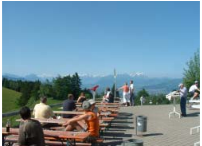
Der Sonntag zeigte sich von seiner ‚sichtigen‘ Seite: vom Pfänder war der Ausblick über den Bodensee und die Alpenwelt grandios. Ebenso beeindruckend waren die Flugvorführungen der Greifvögel.