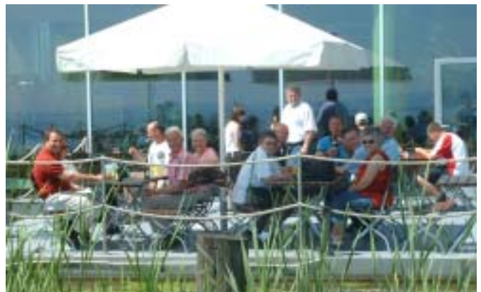
Erneut wurden die Helfer der verschiedenen Aktivitäten des SFVM mit einer eindrucklichen Reise belohnt.